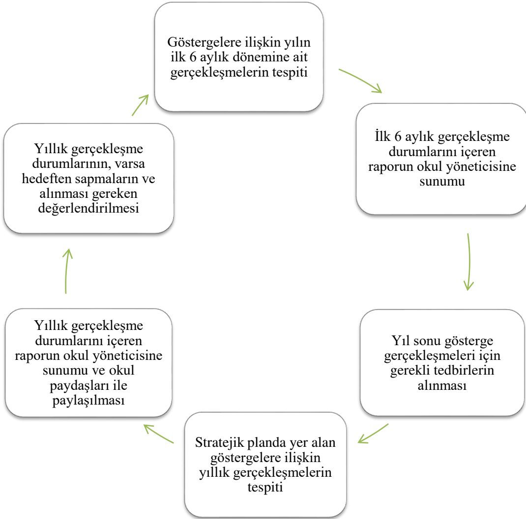
Şekil 1: BigaİÇDAŞ Fen Lisesi 2024-2028 Stratejik Planı İzleme ve Değerlendirme Modeli

Stratejik planlarda yer alan amaç ve hedeflere ulaşma durumlarının tespiti ve bu yolla stratejik planlardaki amaç ve hedeflerin gerçekleştirilebilmesi için gerekli tedbirlerin alınması izleme ve değerlendirme ile mümkün olmaktadır. Stratejik Planda yer alan performans göstergelerinin gerçekleşme durumlarının tespiti yılda iki kez yapılacaktır. Her yılın ilk altı ayında ilgili hedefe ait performans göstergelerinin performans düzeyi dikkate alınarak yapılan izlemenin ardından, yılsonu itibarıyla hedeflenen değere ulaşıp ulaşılmadığının analizi yapılacaktır.